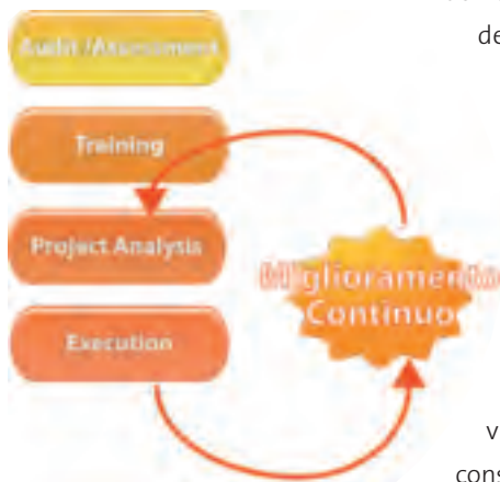
La metodologia Msm, Maintenance system management.

Per risultato si intende il conseguimento di una maggiore affidabilità del sistema, che dovrebbe tendere all'ottimo. L'asset deve essere il più affidabile possibile, abbattendo il numero di guasti, incrementando la disponibilità e riducendo al minimo i costi inattesi per riparazioni e messe in servizio.